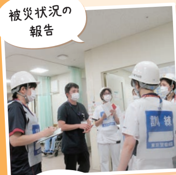
災害対策本部の様子