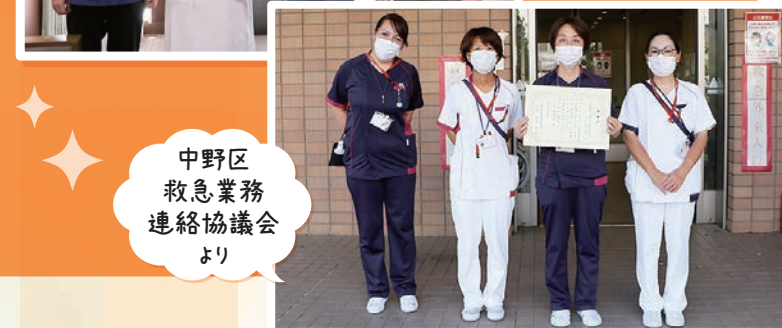
中野区救急業務連絡協議会より